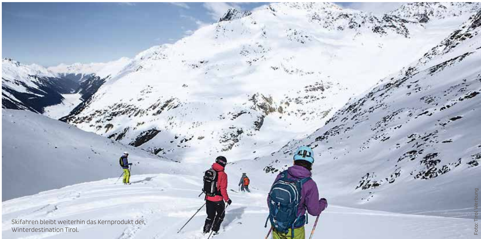
Skifahren bleibt weiterhin das Kernprodukt der Winterdestination Tirol.