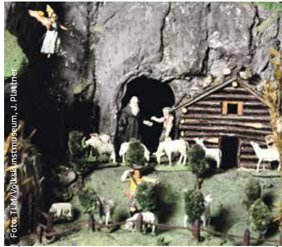
„Probst-Krippe“, Innsbruck 1. Hälfte 19. Jahrhundert, Josef B. Probst