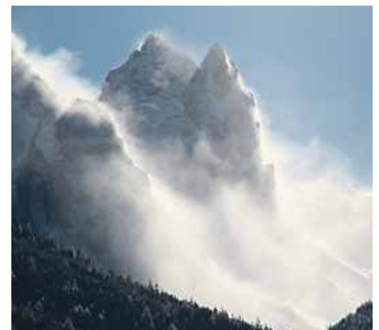
Der Wind gilt als der Baumeister der Lawinen.