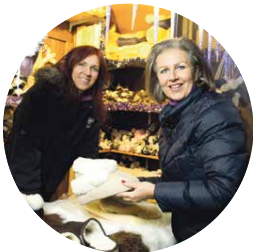
LR in Patrizia Zoller-Frischauf am Christkindlmarkt auf dem Innsbrucker Marktplatz: „Viele Gäste kommen wegen der einmaligen Adventstimmung und Tiroler Qualitätsprodukte.“

nem wichtigen Standbein der Wirtschaft in der Weihnachtszeit gemausert. Das zeigen die steigenden Publikumszahlen genauso wie die Ausgaben-Bereitschaft der Marktgäste und der wachsende Umsatz“, betont die Wirtschaftslandesrätin. Dazu kommt auch die Nachfrage bei Gästen aus dem In- und Ausland, die oftmals extra für ein Adventmarkt-Wochenende nach Tirol reisen.