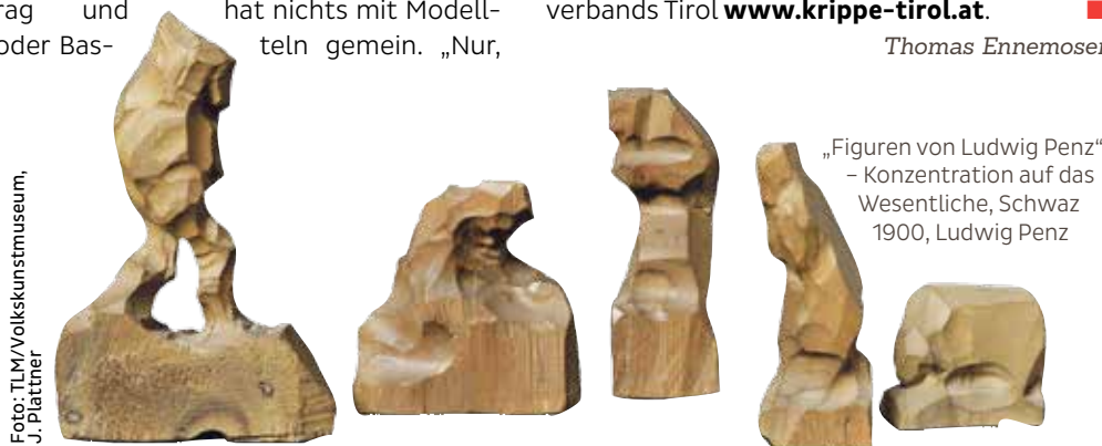
„Figuren von Ludwig Penz“ – Konzentration auf das Wesentliche, Schwaz 1900, Ludwig Penz

Weitere Informationen über das Krippenwesen in Tirol finden Sie unter www.krippe-tirol.at