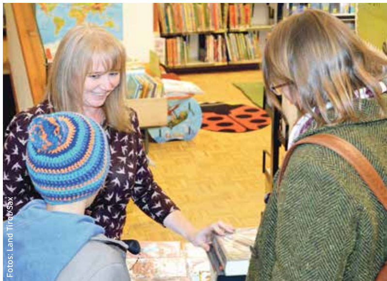
Kompetente Beratung und Vermittlung von Lesefreude – das ist dem Team der Haller Stadtbücherei wichtig.

WIR LESEN ZEITUNGEN UND SPEISEKARTEN, SCHMÖKERN IN BÜCHERN UND CHECKEN E-MAILS: LESEN IST EINE GRUNDKOMPETENZ UND VERMITTELT ZUGANG ZU BILDUNG UND INFORMATION – BÜCHEREIEN LEISTEN DAZU EINEN WICHTIGEN BEITRAG.