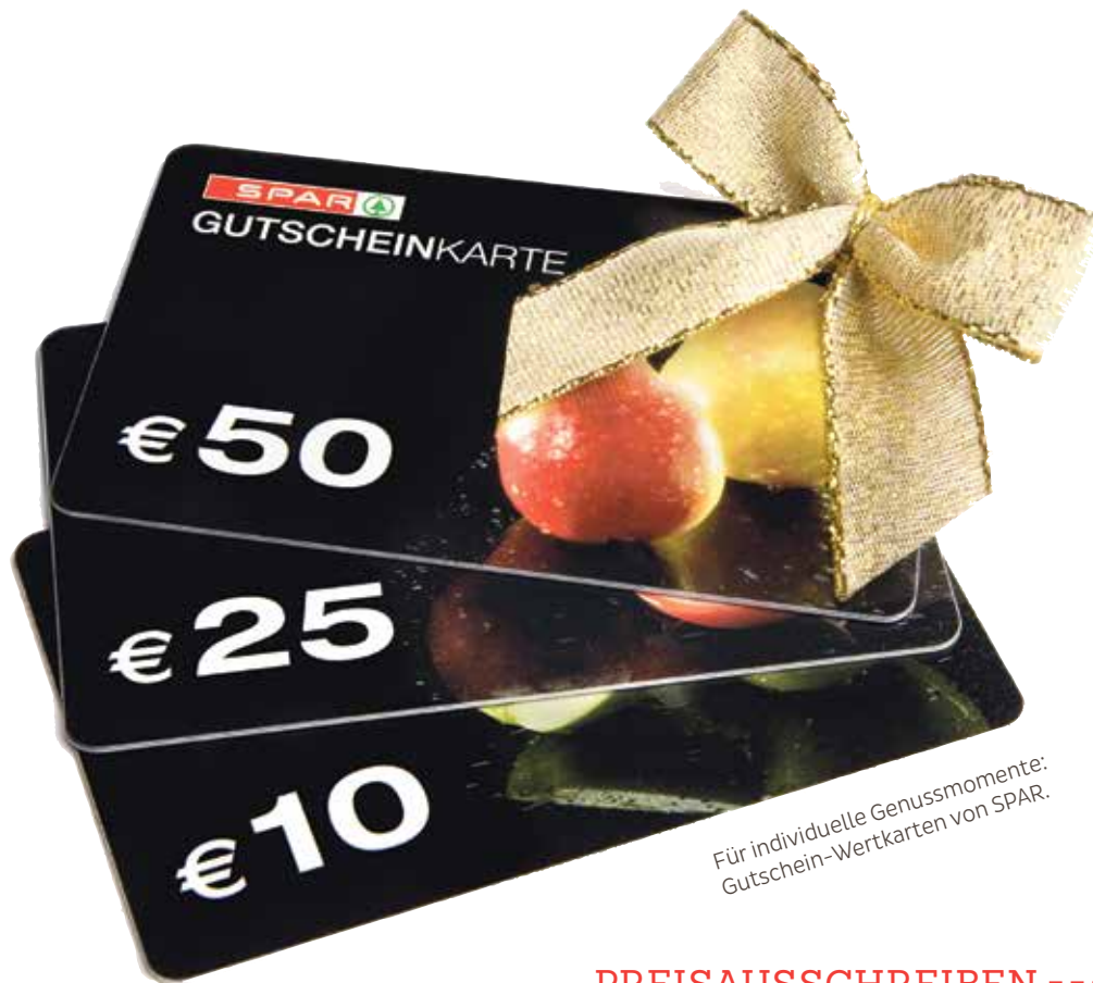
Für individuelle Genussmomente: Gutschein-Wertkarten von SPAR.

SIE SIND PRAKTISCH, EINFACH UND SICHER: MIT DEN GUTSCHEIN-WERTKARTEN VON SPAR KÖNNEN INDIVIDUELLE GESCHENKSWÜNSCHE AM BESTEN ERFÜLLT WERDEN.