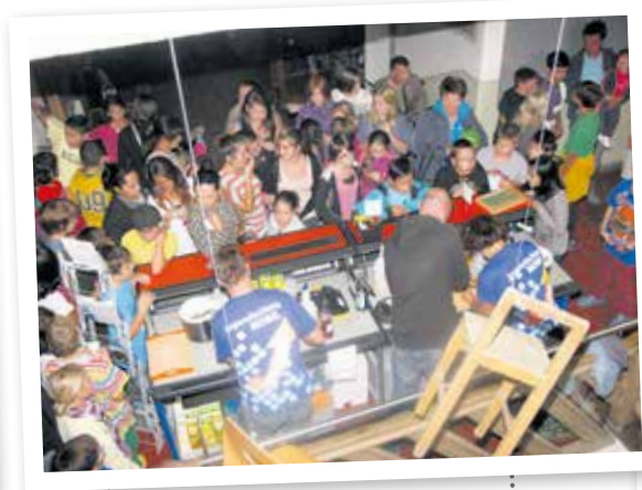
Genießen Sie einen alkoholfreien Cocktail an der MOBILisierBAR.