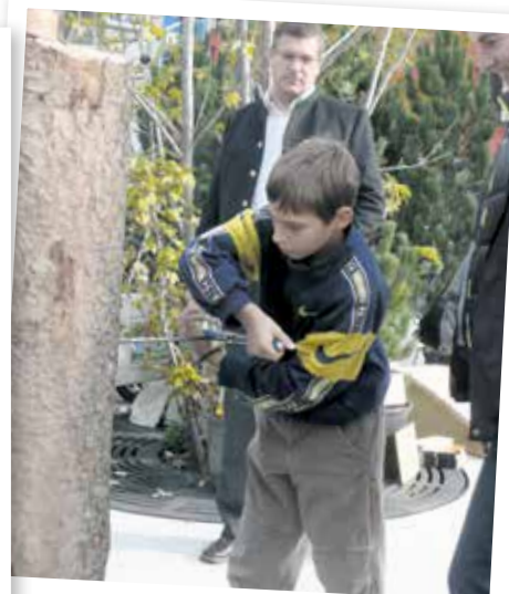
Bohren Sie einen duftenden Bohrkern aus einem Stamm.