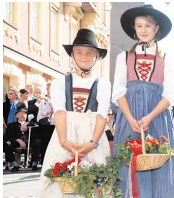
Tradition und moderne Lebensart sind kein Gegensatz.