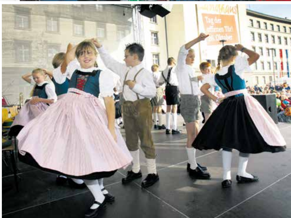
Auch beim diesjährigen Tag der offenen Tür wieder voll im Einsatz: Die Nachwuchstalente des Tiroler Sängerbundes und des Landestrachtenverbandes.