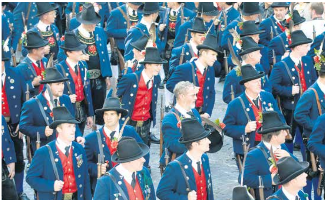
Die Schützenkompanien sind einer der größten Traditionsverbände in Tirol.

Abzeichens nannten die Italiener sie „Blumenteu- fel“. Deutlich erkennbar waren diese Soldaten am Spielhahnstoß auf der hechtgrauen Kappe und dem gestickten Edelweiß mit Stengel auf den Kragenspiegeln (übrigens bis heute Kennzeichen der österreichischen und der deutschen Gebirgs- truppe). Kaiser Karl zeichnete sie mit dem Namen „Kaiserschützen“ aus. Im Unterschied dazu führten die Kaiserjäger ein stengelloses Edelweiß auf schwarzem Hut mit Federbusch. Der Kaiserschützenbund Tirol 1921 ist die offizielle Vertretung der drei Kaiserschützenregimenter sowie der berittenen Kaiserschützen.