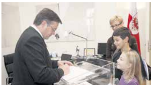
Eine kleine Erinnerung an den Besuch im Landhaus gibt es von LH Günther Platter.