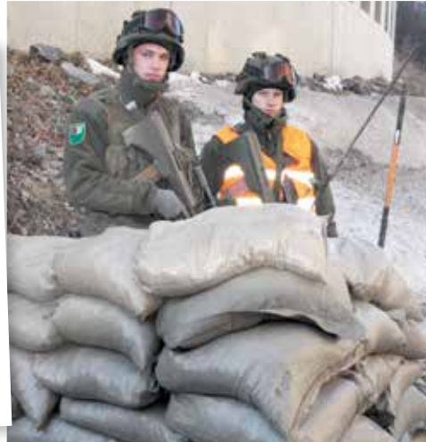
Besichtigen Sie eine nachgebaute UNO-Position des Bundesheeres.