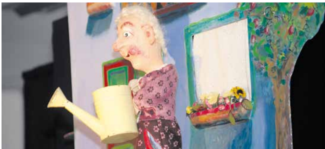
Kasperl und Clowns sorgen für gute Unterhaltung am Tag der offenen Tür.

Vor dem Zelt findet sich bei gutem Wetter der JUFF-Pool. Dieser ist mit vielen Spielsachen und Büchern für die Kleinsten gefüllt. Mit den weichen Bausteinen „Clemmys“ und großen