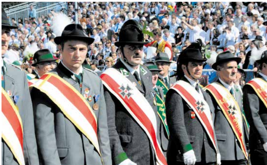
Der Kameradschaftsbund führt sein Tatenkreuz auf den österreichischen Leopoldorden zurück.