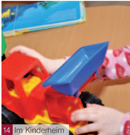
14 Im Kinderheim

Hilfe für Eltern Beratung, um dieser Herausforderung gewachsen zu sein. Seite 6 Gemeindekatalog Wie Nachhaltigkeit täglich gelebt werden kann. Seite 18 Kinderbetreuung in Tirol Auf den drei Seiten des Tiroler Landtages. Seite 20 Preisausschreiben 50 x 2 Konzertkarten für Carmina Burana werden verlost. Seite 27