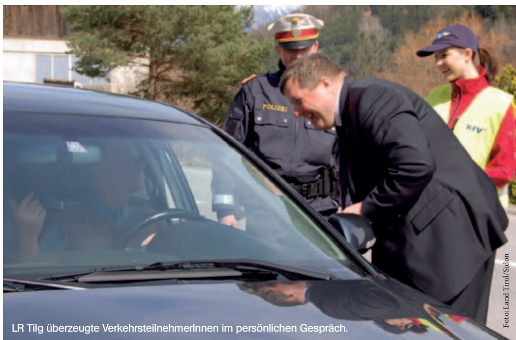
LR Tilg überzeugte VerkehrsteilnehmerInnen im persönlichen Gespräch.