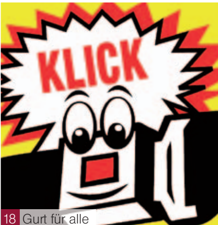
18 Gurt für alle