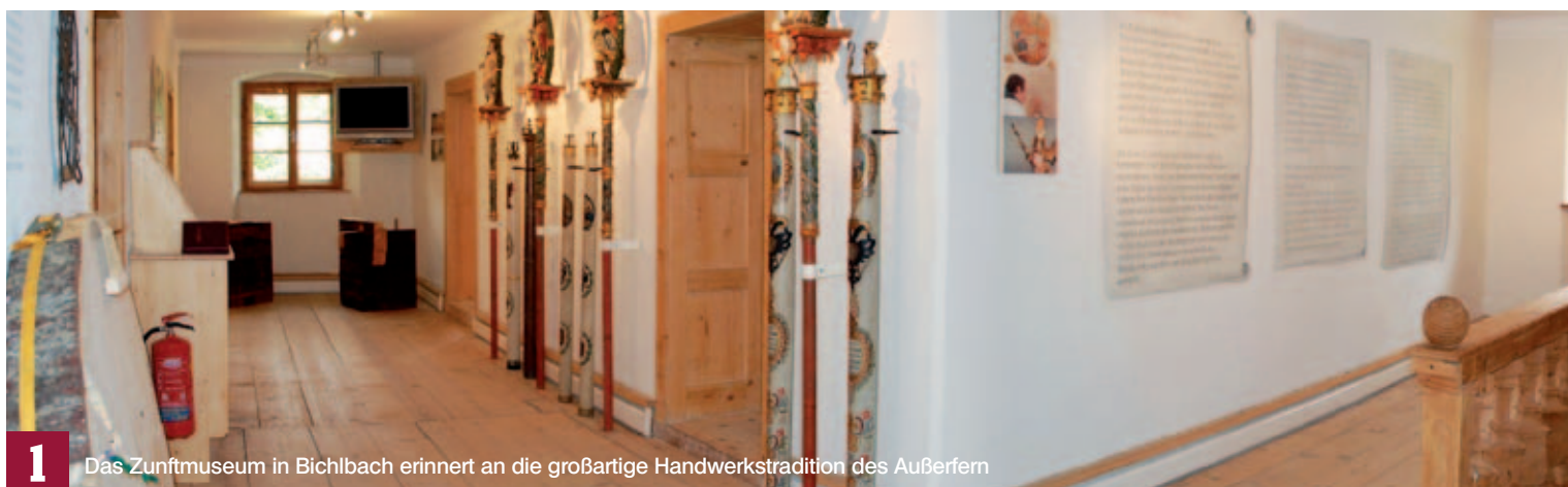
1 Das Zunftmuseum in Bichlbach erinnert an die großartige Handwerkstradition des Außerfern