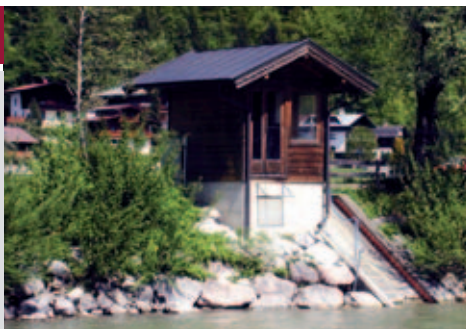
Pegelmessstellen sorgen für eine rechtzeitige Alarmierung im Hochwasserfall.

Der Schutz vor Naturgefahren ist im Gebirgsland Tirol eine wesentliche Aufgabe der öffentlichen Hand. In Zusammenarbeit mit der Wildbach- und Lawinenverbauung Tirol, dem Tiroler Forstdienst und der Abteilung Wasserwirtschaft des Landes Tirol werden 2010 rund 68 Millionen Euro in die Schutz-Infrastruktur und zur Qualitätssicherung verwendet. Dabei fließen rund 35,5 Millionen Euro in den Schutz vor Wildbächen und den Hochwasserschutz an Tal- und Hauptgewässern. Mehr als 20 Millionen Euro stehen für die Schutzwalderhaltung und -sanierung bereit, 10,9 Millionen Euro für den Lawinenschutz. Rund 1,7 Millionen Euro gehen in Schutzmaßnahmen vor Steinschlag.