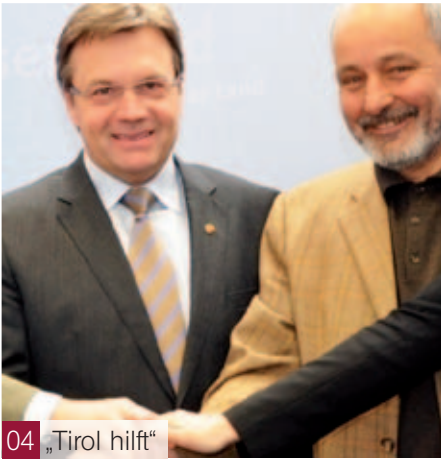
04 „Tirol hilft“