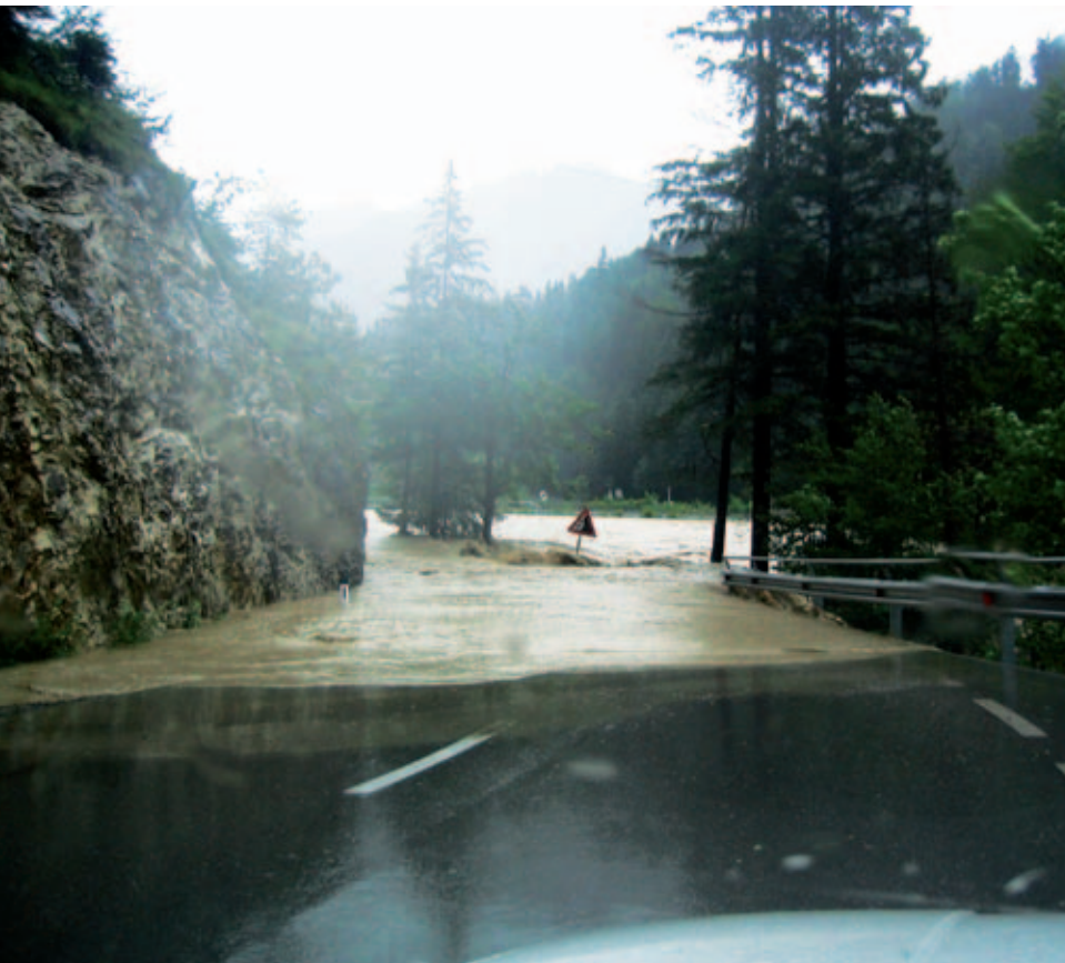
Enorme Schäden richtete das Hochwasser im Jahr 2005 in Tirol an.