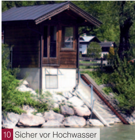
10 Sicher vor Hochwasser

Hilfe für Eltern Beratung, um dieser Herausforderung gewachsen zu sein. Seite 6 Gemeindekatalog Wie Nachhaltigkeit täglich gelebt werden kann. Seite 18 Kinderbetreuung in Tirol Auf den drei Seiten des Tiroler Landtages. Seite 20 Preisausschreiben 50 x 2 Konzertkarten für Carmina Burana werden verlost. Seite 27