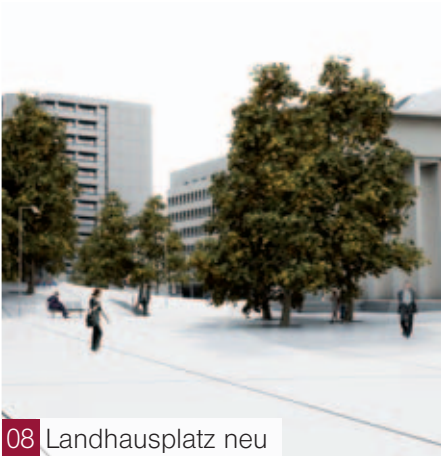
08 Landhausplatz neu

Ihr Christian Switak Landesrat für Öffentlichkeitsarbeit