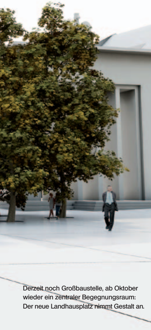
Derzeit noch Großbaustelle, ab Oktober wieder ein zentraler Begegnungsraum: Der neue Landhausplatz nimmt Gestalt an.

In Tirol hingegen sind für 16- bis 18-Jährige nur Bier und Wein erlaubt. „Von lockeren Alkoholbestimmungen halten wir hier nichts. Harte Getränke und auch Alkopops dürfen junge Tirolerinnen und Tiroler erst ab 18 konsumieren und das muss auch so bleiben. Alles andere ist für mich kein Jugendschutz“, stellt die Landesrätin klar und fordert, dass der Jugendschutz in der Kompetenz der Länder bleiben muss. Christian Mück ■